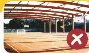
Kawasan terbuka yang panas